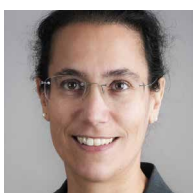
DI IN JUDITH ENGEL VORSTÄNDIN ÖBB-INFRASTRUKTUR AG