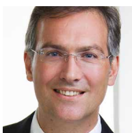
UNIV.PROF. DI DR.TECHN. PETER ERTL VIZEREKTOR FÜR FORSCHUNG, INNOVATION UND INTERNATIONALES