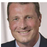
UNIV.PROF. DI DR.TECHN. WOLFGANG WAGNER DEKAN DER FAKULTÄT FÜR MATHEMATIK & GEOINFORMATION