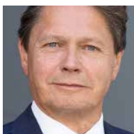
DI WOLFGANG ANZENGRUBER EHEMALIGER VORSTANDSVORSITZENDER VERBUND AG