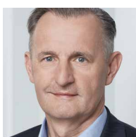
DI PETER WEINELT GENERALDIREKTOR-STELLVERTRETER WIENER STADTWERKE GMBH